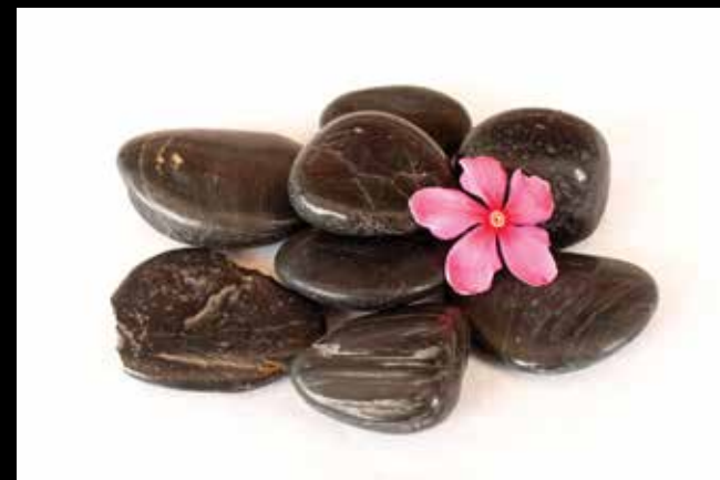
Marja Kraljič: Kamenje in cvet