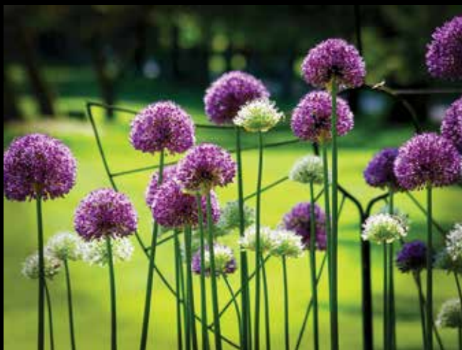
Anuška Vončina: Sloka družina