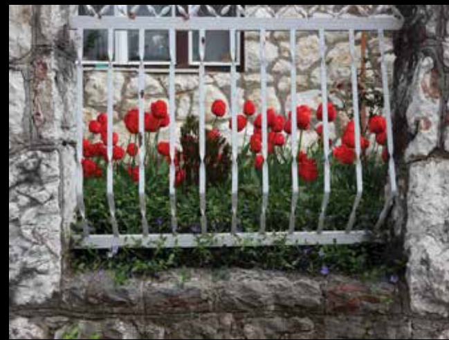
Petra Puhar: Sarajevo III