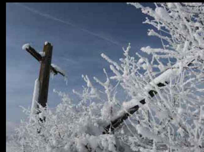
Petra Puhar: Zima zima bela