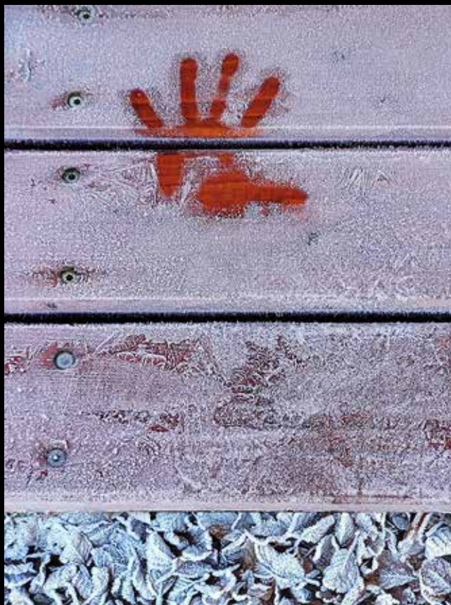
Biserka Komac: Stop Zimi