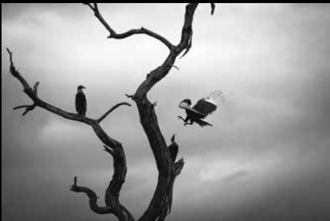
Anuška Vončina: Polnost praznine