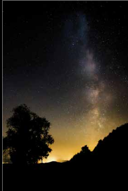
Maša Snoj: Mlečna cesta